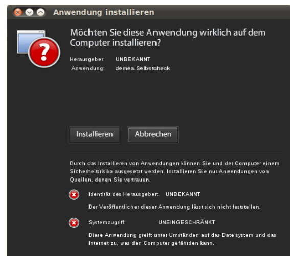
Abbildung 2: Bestätigen Sie die Installation