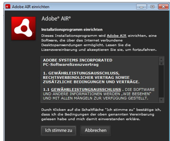
Abbildung 1: Abfrage der Lizenzvereinbarung von Adobe Air