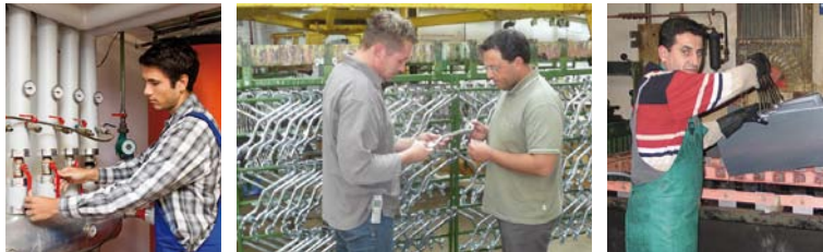
Layout: liniezwei GbR Gedruckt auf 100% Recyclingpapier ÖkoArt matt